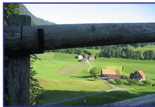
Sattel - Blick Richtung Morgarten