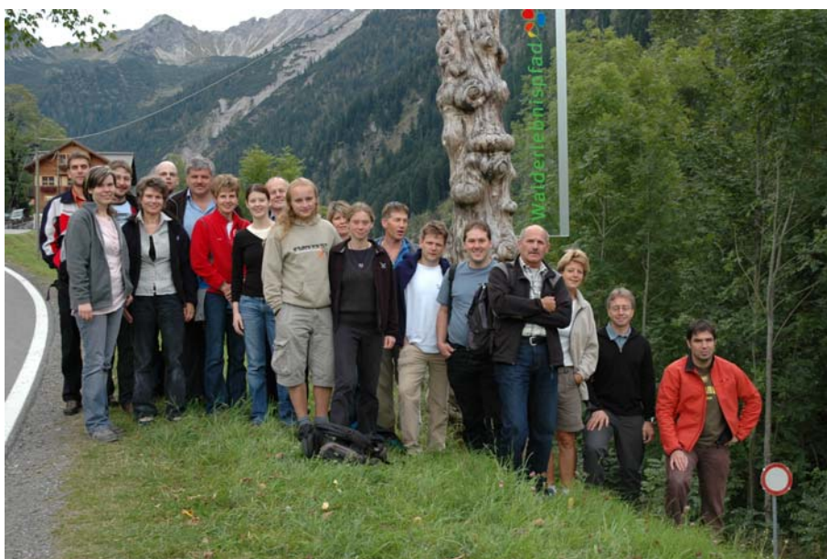
Abb. 1: Das Projektteam auf seinem Ausflug ins Grosse Walsertal